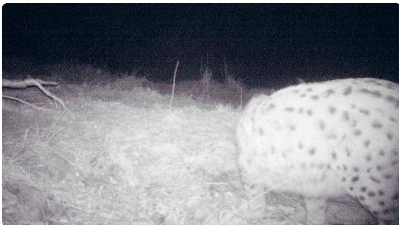
Foto n. 1 - La lince ripresa a Tremalzo

Nel corso del 2015 , è stata documentata con certezza la presenza del felide in almeno un'occasione, quando è stato ripreso con fototrappola da un cacciatore nei boschi di Tremalzo (Val di Ledro), in data 20 aprile 2015 (foto n. 1); una settimana prima, nella stessa zona, vi era stato pure un avvistamento. Infine, orme su neve sono state rilevate da personale forestale nei pressi di cima Avèz (sempre in Tremalzo) il 29 aprile .